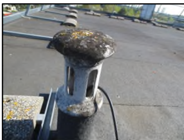
Photo N° 666 AMIANTE CIMENT -- Toiture terrasse Toiture Chapeau (Fibres-ciment)