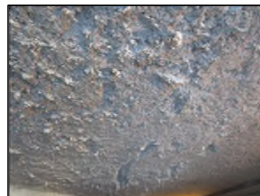
Photo N° 663 ECH-N°1 FLOCAGE -- LOCAL POUBELLE Plafonds blanc cotonneux