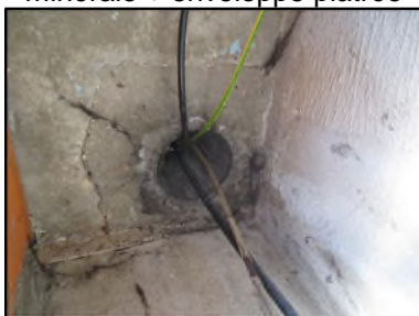
Photo N° 665 AMIANTE CIMENT -- Gaine technique Gaz - 4 Conduits Ventilation haute (Fibres-ciment)