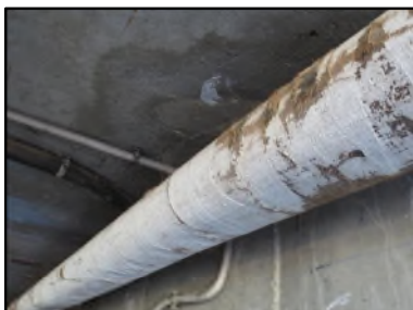
Photo N° 659 ECH-N°2 CALORIFUGEAGE --LOCAL POUBELLE Conduits de fluide Laine minérale + enveloppe plâtrée

Dossier n°: 2013-09-300 FK DTA PC_041LAO_OPH